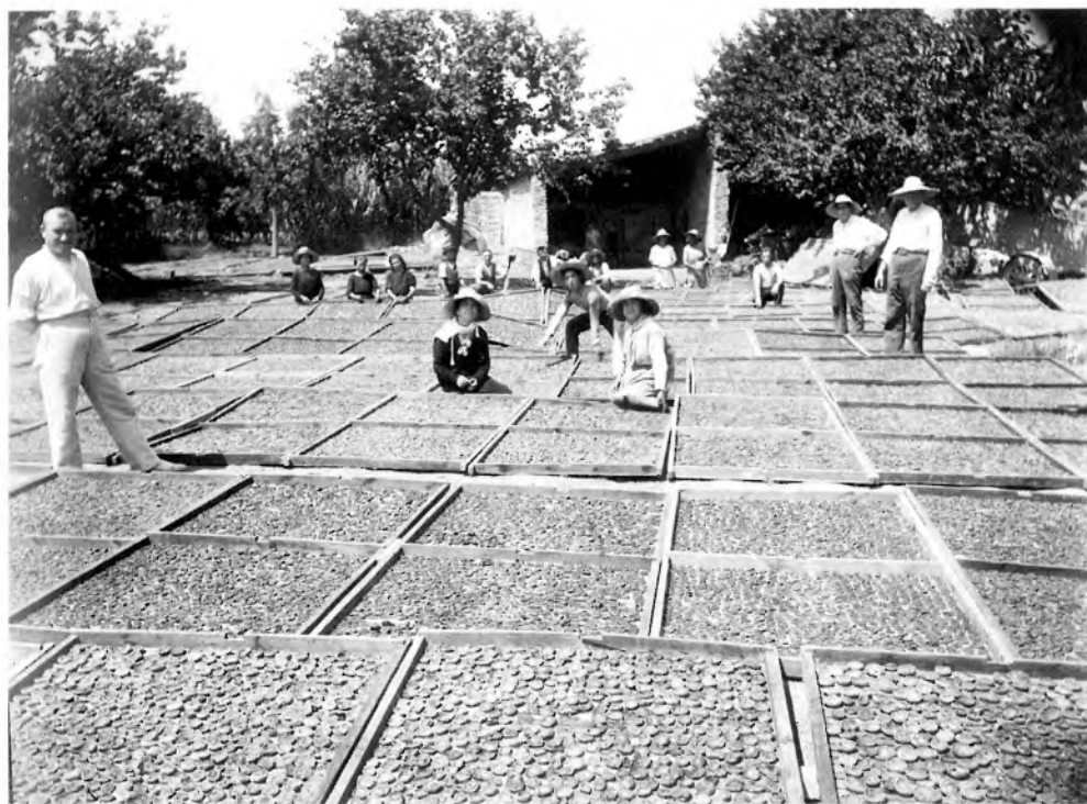
Procedimiento secado de albaricoque búlida en la Fábrica de Esteva Canet.

industrial, especificada en la conserva de la fruta, con reflejos inmediatos en Alcantarilla a través de su hijo y nieto, nombres dedicados a su impulsión y atareados en poner en movimiento un programa de fecunda actividad en el interior de la fábrica, con la hechura arquitectónica que ya es una evocación, un tanto de época, muy enternecedora y donde la presencia de la nave y de la chimenea compone la nota ilustrativa de su paisaje, que aún nos hace estremecer cuando avistamos sus enhietas 11 siluetas en nuestros itinerarios por las pedanías huertanas, por los pueblos y parajes de la región, donde sin duda la chimenea alta, que ya es patrimonio de interés estético, impone y sugiere todo aquel