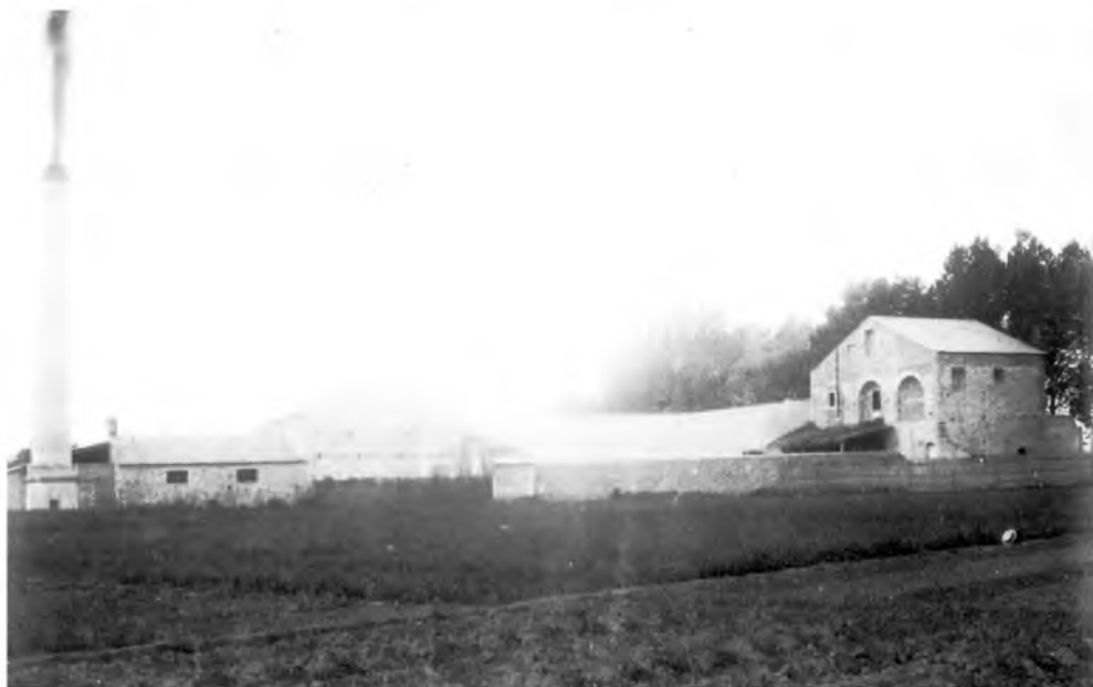
Inauguración Fábrica Conservas Esteva Canet.