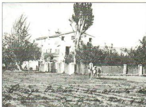
Foto Torre Zorzosa, 1901. La Albatallía.

Pensaba que me encontraba ante una persona que me había hecho navegar en esa hacienda día a día y durante varias generaciones pero que en la actualidad no se conservaba ningún rasgo de ese pasado modo de vida; mi sorpresa fue el descubrir que todavía realizan la cría del gusano de la seda.