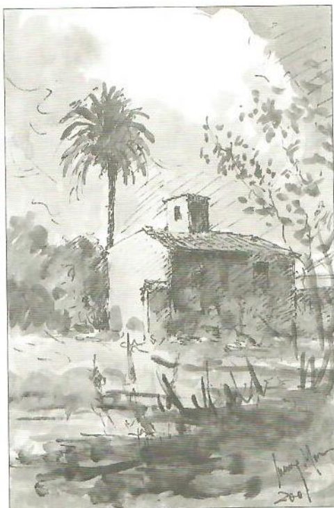
Típica torre huertana.

Lamentablemente, Casas-torre, existen muy pocas con estructura íntegra siendo también escasas las que la poseen mutilada o intensamente degradada; sin embargo, las alusiones documentales a este tipo de edificios y la toponimia, han conservado memoria de su abundancia y localización: El Códice de Repartimiento de Murcia (siglo XVIII), menciona las Torres de Tetrayra, del Molino; de las Lavanderas, etc. El 15 de septiembre de 1542, el Comendador D. Pedro Zambrana y Arróniz en la enumeración de fincas, figura la torre después conocida por Torre de Junterón o Zambrana, que aportó doña Catalina Zambrana y Carella al casarse con don Gil Rodríguez de Junterón Cascales, en sus Discursos Históricas (pri-