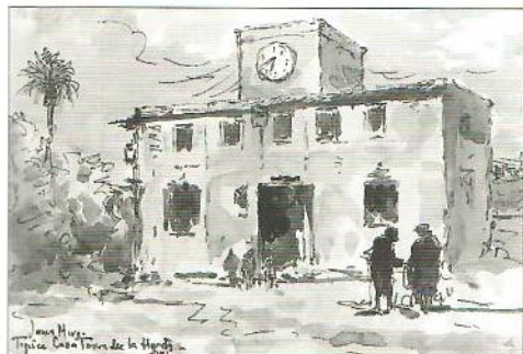
Típica casa torre de la huerta.