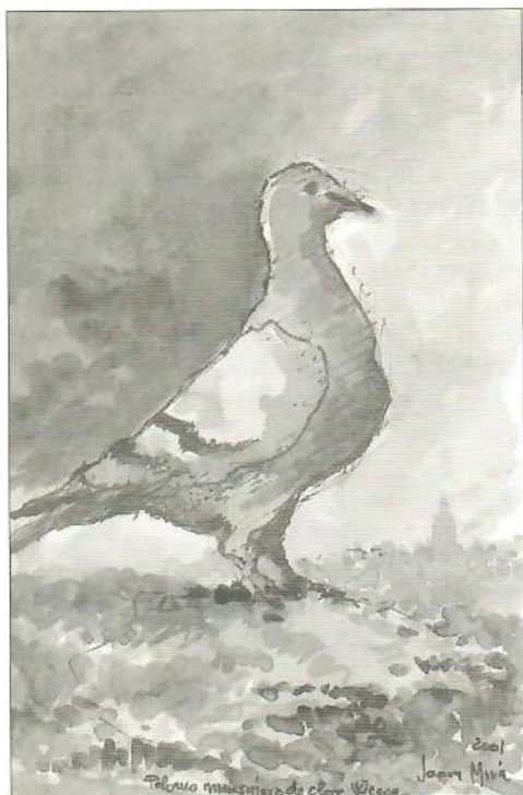
La paloma vista por Saura Mira.

desarrollo de la disciplina en la Colombofilia y Colombicultura), ser vivo admirado por su belleza y facultades, resulta realmente curioso y sorprendente, rozando lo sarcástico, como la paloma, se ha hecho dueña de aleros y rincones en los edificios de las ciudades, que a pesar del terrible factor devastador de sus excrementos, mantienen una hegemónica ocupación compartida, en virtud de elementales señas de identidad pacifista, estético ornamental y medio ambiental, y supuestamente, quizás al propio hecho, de posibilitar la mística y grácil compañía, o trivial entretenimiento, para todos, mayores y niños, en los muchos días de asueto; mientras deambulamos ociosamente por paseos y jardines de la urbe que devoramos.