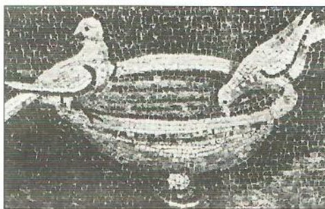
Mosaico del s. V, conservado en el Mausoleo de Galla Placidia en la ciudad italiana de Ravena.