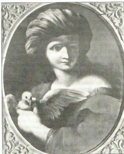
Doncella posando con paloma. Cuadro de Francesco Romanelli que se conserva en el Palacio de Campidoglio en Roma.