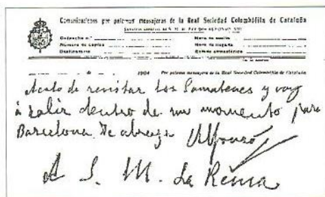
Despacho de "Colombofilia mensajera" de Alfonso XIII a su madre la Reina Dña. Cristina.

romana. Actualmente, con motivo de este suceso, la Tierra, almacena el habla de unas 3.000 lenguas escritas distintas, entre idiomas y dialectos, agrupadas en familias, que a su vez, con el tiempo, mejoran o desaparecen.