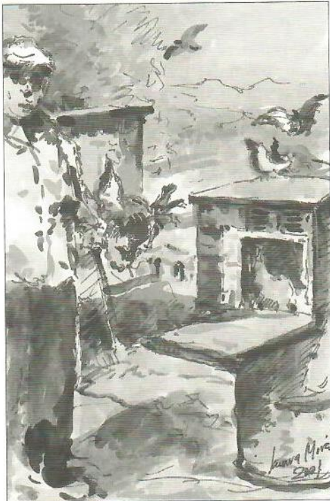
Palomar a nivel del cuerpo.

Allí, por aquellos lares, nos depara, a poco que nos fijemos, una imagen perfilada en el horizonte, de estructuras elevadas a varios metros de altura, sosteniendo cajas de madera, o también estas, apoyadas encima de postes a nivel del cuerpo, que te confunden con instalaciones de supuestos panales de abejas, que solo logras reconocer su utilidad, en la justa aproximación al borde de su ubicación.