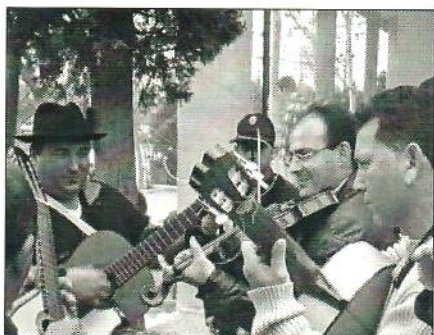
Maestros Boleros en la Huerta de Murcia

Día 11.- Por la tarde, á las cinco, se celebrarán bailes populares en el jardín de Floridablanca, á usanza de la huerta, adjudicándose premios á las parejas que se presenten mejor vestidas con el típico traje huertano, como igualmente á las que mejor bailen. [...]."