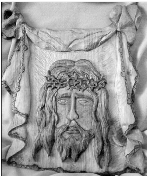
Una talla en madera del paño de la Mujer Verónica, de Campos.

de su casa, una vez liberado y para no caer como la mayoría de las personas en una depresión empezó con este oficio de tallista en madera, lo primero que realizó para su padre fue un carro en madera tal como el lo había visto en su pueblo, regalo que le ofreció a su progenitor y el cual quedó muy ilusionado con el trabajo de su hijo, tal fue el resultado que decidió hacer otro igual para él, petición que le hizo su mujer, siendo estas las piezas que le animaron a seguir trabajando con la madera, realizando más tarde para su pueblo una Cruz Guía para la Hermandad de Nuestro Padre