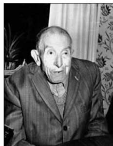
El artista Antonio Carrión Valverde, antes de su fallecimiento.

Antonio Carrión Valverde, Nace en Murcia en el año 1892, siendo uno de nuestros artistas más completos que