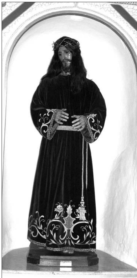
Nazareno realizado por Carrión en 1944 para la localidad de Aledo.

En el año 1942 obtuvo el segundo premio de escultura en la Exposición Regional de Artistas Murcianos. En 1966, se le concedió la medalla de oro al mejor artesano nacional. En 1973, la Galería de Arte Zero de Murcia, organizó en su honor una exposición homenaje. En 1980 participa en el Salón de Escultura, que tuvo lugar en el Museo de Bellas Artes de nuestra ciudad. En 1981, a petición del Museo de Bellas Artes se expone una selección de sus dibujos del natural, en Noviembre de 1994 la Galería Pasaje expone una selección de sus dibujos a lápiz de modelos al natural, junto con algunas de sus libretas de apuntes. En junio de 1982 un año antes de morir Antonio Carrión Valverde y a propuesta de la asociación cultural-artesana Gremio Regional de Artesanías Varias fue galardonado por su Majestad el Rey Don Juan Carlos I en la Feria Iberoamericana de