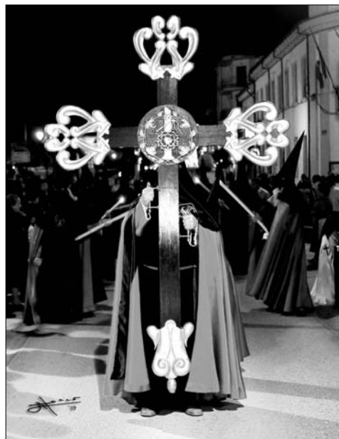
La Cruz de guía realizada por Campos para Peal de Becerro (Jaén).

Campos sigue trabajando en varias obras religiosas y profanas como las restauraciones que ha empezado para la cofradía de Nuestro Padre Jesús Nazareno de Quesada de una Verónica y un San Juan, y con la ilusión de hacerse un espacio en este mundo de la restauración y la talla en madera, sus trabajos ya han sido expuestos en varias salas de la Comunidad de Murcia, tuvo la oportunidad también de que se pudieran ver en colectividad en la capital de España y fuera de nuestro territorio nacional en la localidad portuguesa