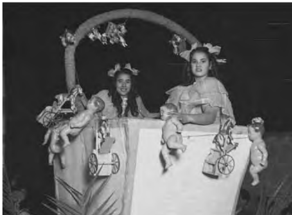
Batalla de las Flores. Murcia. Años 40

Una vez terminados, se vendían para las Fiestas de Primavera, ferias y Reyes Magos, para después comercializarlos en los bazares y comercios más importantes de la ciudad, como El Bazar Murciano y los grandes almacenes La Alegría de la Huerta.