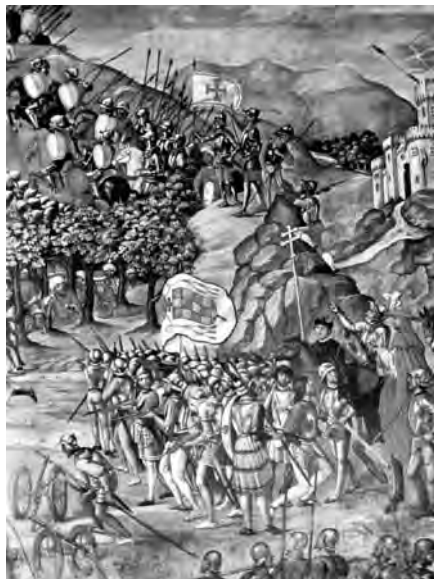
Guerra de Orán 1517