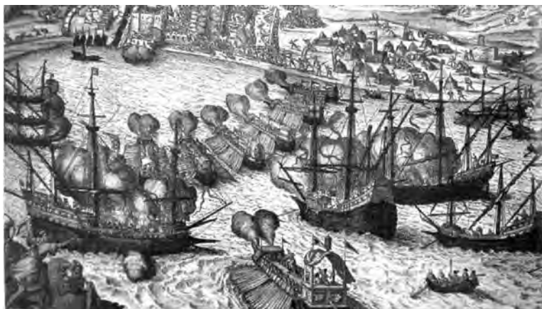
Segunda expedición contra Argel 1518