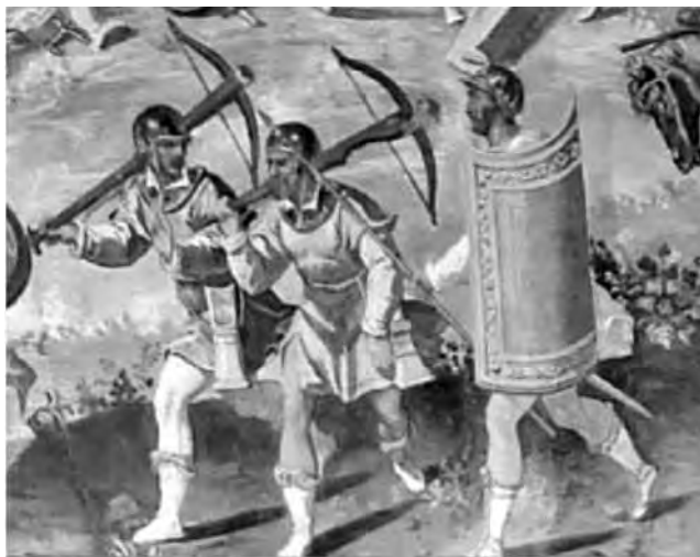
Modelo de peón de pie en la guerra de Orán

Carlos I en su empeño de anexas a su imperio las tierras del norte de África inició una serie de relaciones y acuerdos con príncipes norteafricanos que no dieron resultados aparentes, ya que las dos expediciones a Argel y a Orán fueron catastróficas porque se perdió gran parte de la gente desplazada, unos, muertos en batalla, otros, ahogados en el mar debido a tormentas que azotaron la costa, y el concejo de Murcia se responsabilizó de una serie de gastos que entre promesas incumplidas de unos y otros, terminaron pagando los ciudadanos de Murcia.