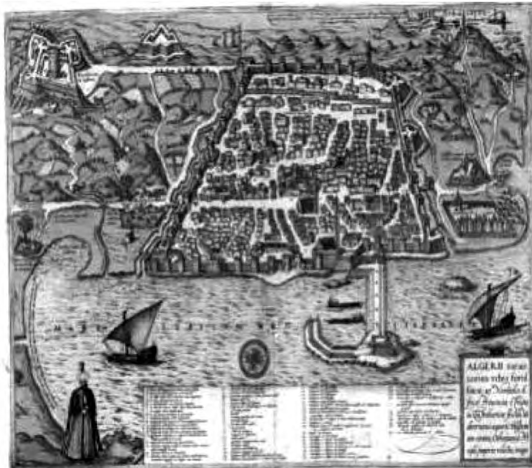
Plano de Argel siglo XVI

Keywords: Council of Murcia; Algiers; Oran; Sixteenth century.