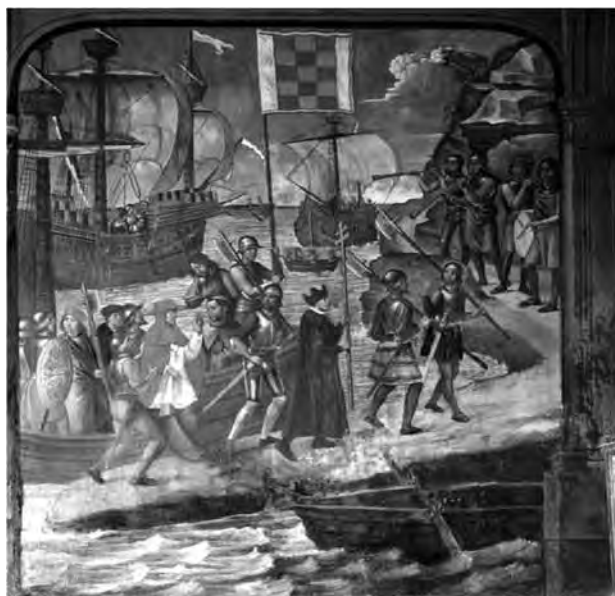
El cardenal Cisneros en la conquista de África

Desde 1510, los españoles estaban establecidos en una pequeña isla frente a Argel, en la que construyeron una serie de fortificaciones y asentaron una guarnición de doscientos hombres. España obligó al gobernante de la ciudad Selim Al Tumi, a firmar un tratado y someterse a vasallaje, pero ante la presencia española Al Tumi negoció con los hermanos Aruj y Jeireddin, apodado Barbarroja, corsarios al servicio del sultán otomano Suleiman, para expulsar a los españoles instalados en Argel, pero lo asesinaron y se apoderaron de la ciudad.