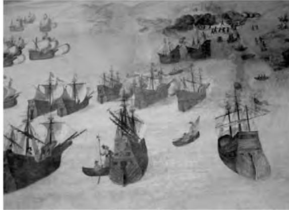
Desembarco en Argel. Siglo XVI

bativo: Barbarroja. A la vista del peligro, Cisneros ordenó preparar una armada para su defensa. 2