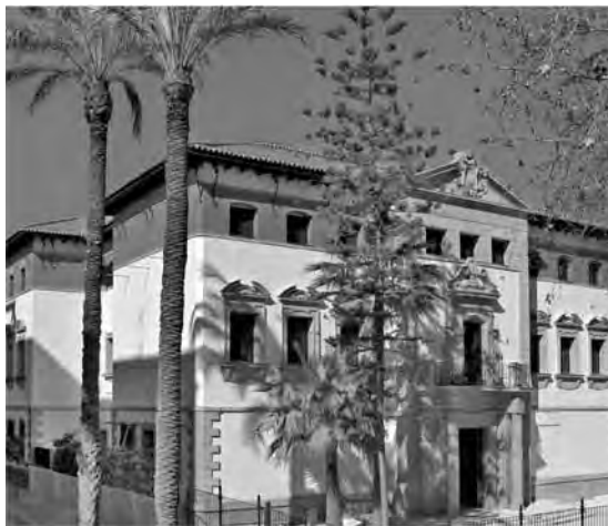
Museo Arqueológico de Murcia