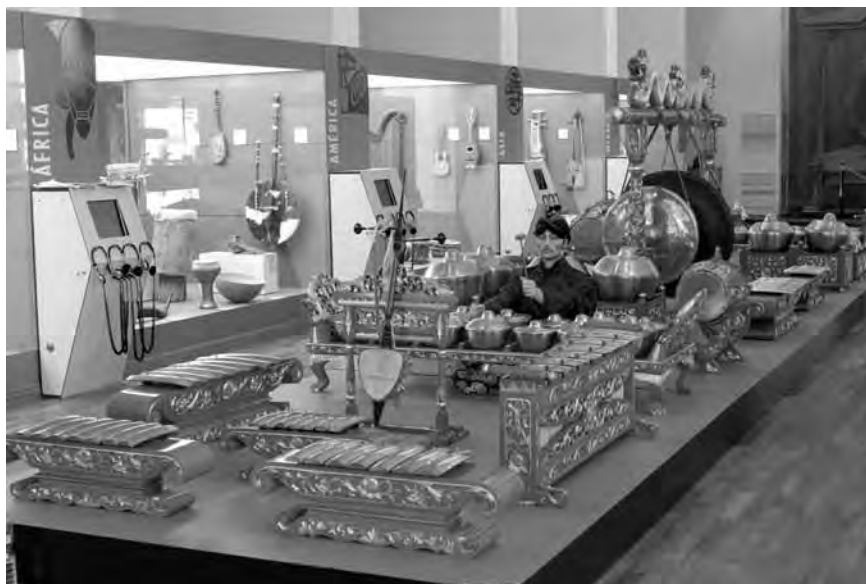
Museo de la Música Étnica de Barranta

Creado en 2002, el edificio fue proyectado por el arquitecto Jesús Carballal e inaugurado cuatro años después. La colección consta de instrumentos musicales de los cinco continentes, fruto de los viajes y de los trabajos de investigación desarrollados por Carlos Blanco Fadol durante más de treinta años.