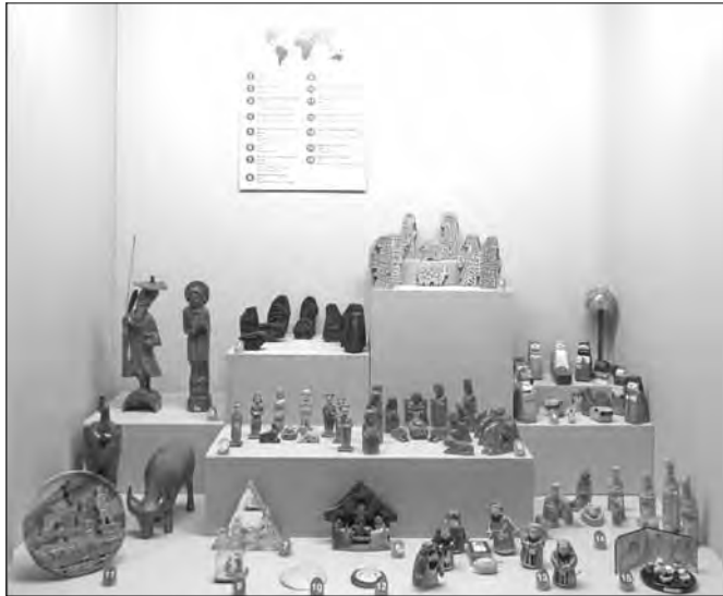
Vitrina de Asia

y tradiciones de los diferentes países a través de las vestimentas, oficios, fisonomías, flora, fauna, materiales, etc., que reflejan las más de 2.700 figuras expuestas.