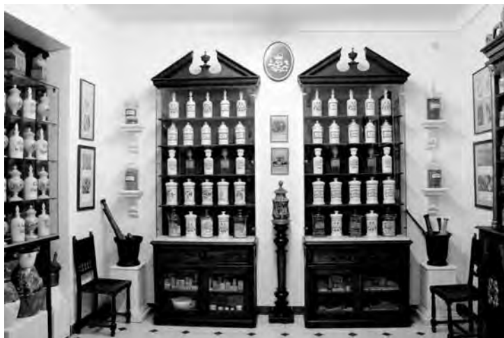
Botica. Museo Jerónimo Molina

dicionales, hoy desaparecidos. En la sección de paleontología se hace excepcional una amplia colección de fósiles del término municipal y las huellas de animales prehistóricos de los yacimientos de la Hoya de la Sima y Sierra de las Cabras.