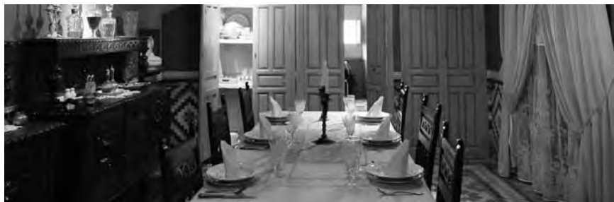
Comedor. Casa de Pepe Marsilla en Bullas

la antigua bodega y la muestra de objetos de carácter etnográfico relacionados con la viticultura y vinificación.