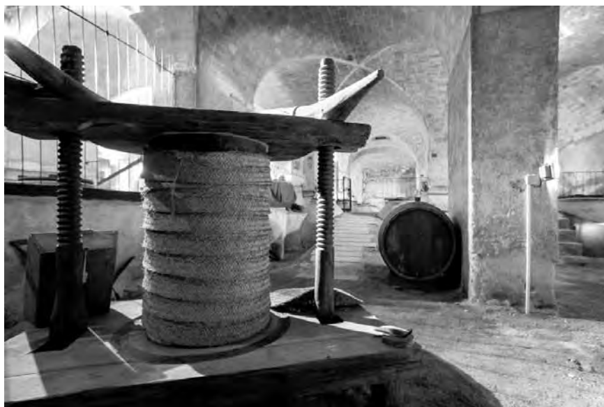
Museo del Vino de Bullas

En su interior se conservan en perfecto estado tanto la decoración de estilo modernista de la parte residencial como las diferentes dependencias en las que se dividía la zona de labor. En la bodega podemos apreciar el espacio dedicado a la producción de vino con destino a la venta, y otro reservado para guardar los caldos más selectos de consumo particular. En total se conservan cincuenta y siete tinajas con una capacidad superior a los 140.000 litros de vino.