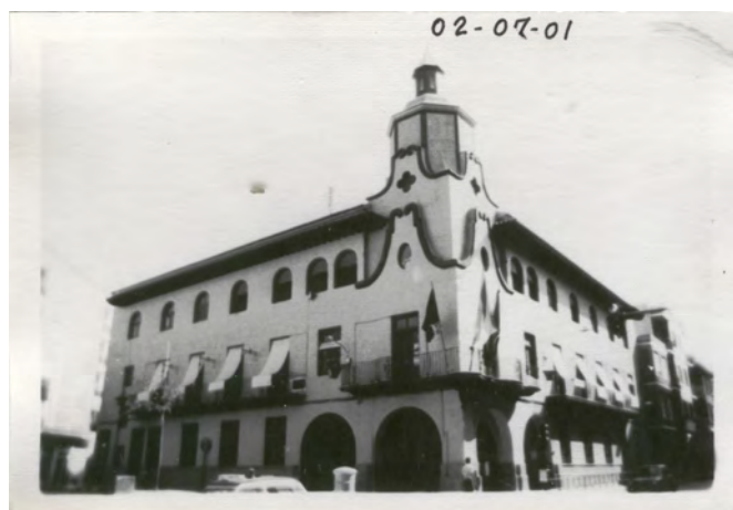
Figura 3. Casa Ayuntamiento.1983.