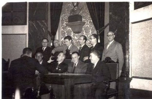
Figura 7. Interior del salón de sesiones con la corporación municipal, presidiendo el busto del general Franco, obra de Nicolás Martínez. Años 50.

[...] Tuvo lugar la inauguración del magnífico salón de sesiones del Ayuntamiento, luego de su bendición con el ceremonial acostumbrado y cuya obra se debe al proyecto y dirección del arquitecto Joaquín Dicenta. El salón está decorado y construido sólida y exquisitamente respondiendo a las mayores exigencias de buen gusto. Preside el local un busto de bronce de nuestro caudillo, obra de Nicolás Martínez y en preferente lugar se destaca una imagen del Corazón de Jesús. En el acto inaugural ocupó la presidencia el Gobernador Civil y Jefe provincial, acompañado del alcalde de Alcantarilla.