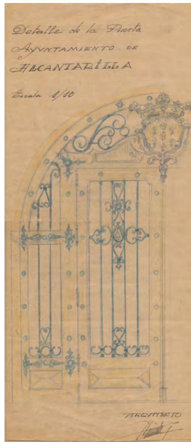
Figura 5 y 6. Alzado de la fachada de la plaza de San Pedro y puerta principal. 1945. Proyecto Casa Ayuntamiento de Alcantarilla. Joaquín Dicenta.