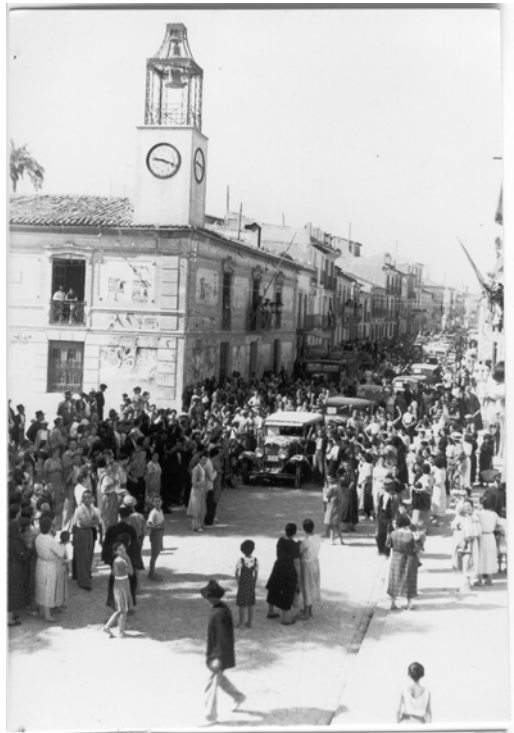
Figura 2. Casa Ayuntamiento antiguo, con torre.1935.

ocasiones, era el mismo sacristán el que desempeñaba el cargo de relojero 9 de la Villa. El reloj marcaba las horas y medias en conjunción con las campanas; no solo los actos religiosos y el comienzo y final de la vida laboral, sino también las horas que regulaban las tandas de riego de la huerta para dar aviso a los regantes del reparto y distribución del agua en las acequias, según las ordenanzas y costumbres de la huerta de Murcia. En el refranero huertano, se decía «Tu tanda si no has de regar, déjala pasar; también, agua que no has de beber, déjala correr, porque, es sabido que, sobras de arriba, dotación de abajo», o para las acequias sin tanda «el que está denantes bebe antes» (Díaz Cassou, 1889). En 1930, la agrupación municipal decidió construir una torre en la esquina de la Casa Ayuntamiento para instalar el reloj público de cuatro esferas adquirido en la relojería Blasco y Liza de Roquetas (Tarragona), por la cantidad de 9.800 pts. (Figura 2), inaugurado en la festividad de San Pedro 10 , desde donde se seguiría marcando las tandas de riego de la huerta de Alcantarilla.