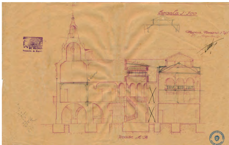
Figura 4. Alzado del interior: 1945. Proyecto Casa Ayuntamiento de Alcantarilla. Joaquín Dicenta. Archivo Municipal de Alcantarilla (digitalizado y restaurado por Juan Cánovas 28 ).

acceso de escaleras, la que arranca en el piso principal de uso interno, y la otra con acceso desde la calle hasta las azoteas y al cuarto del reloj municipal.