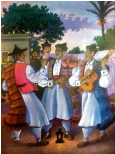
Auroros con guitarra.

No hay que olvidar sus carteles y representaciones de las fiestas de nuestra región. La feria taurina de septiembre, el Bando de la Huerta, Las tunas, el Entierro de Sardina, las romerías, la Semana de la Huerta de los Alcázares, el Auto de los Reyes Magos, la Semana Santa. En todo se reflejaba su amor por su tierra, Murcia.