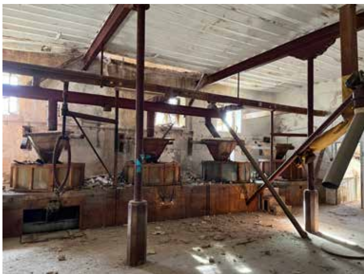
Sala de molienda del Molino Armero, Cabezo de Torres (Murcia).

Tras esto, la ñora se procesaba en el inmueble para llevar a cabo su molienda en la sala que conserva intactas sus piedras de moler y toda la maquinaria que se empleaba para aprovechar la energía hidráulica procedente de la acequia de Churra La Vieja, paralela a la finca, cuyo ramal discurría bajo la instalación. La autora ilustra este valioso tesoro industrial con fotografías del estado actual